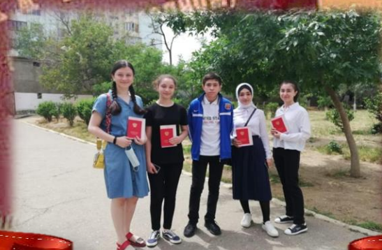
Медалисты 9 «а» класса